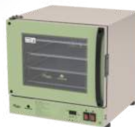
Forno Turbo Elétrico Digital – Flakes PRP-004 Plus Flakes