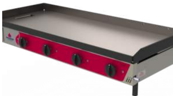
Chapa Bifeteira A Gás PR-1200 G Style