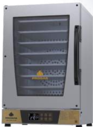
Forno Turbo PRP-008 Plus PRP-008