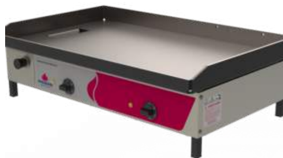
Chapa Bifeteira Elétrica PR-800 E Style